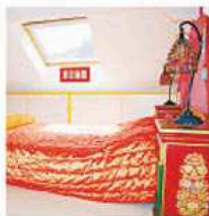
La chambre «Bombay».

Avec des prix variants entre 890 et 2490 € la semaine, ce séjour saura à coup sûr ravir les plus grands comme les plus petits. F. K.