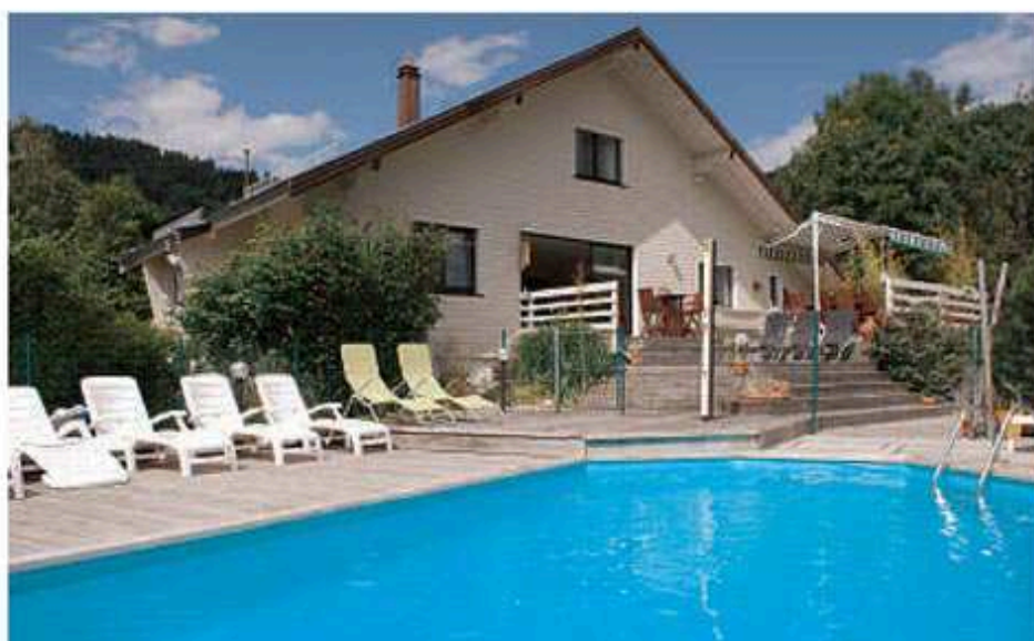
«La Parenthèse» dévoile tous ses charmes sous un soleil d'été.

Pour le confort, six chambres à thèmes (Togo, Roman-