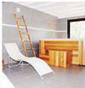
La salle détente et son jacuzzi.